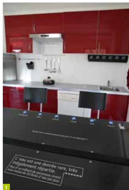
architecte : François Pélegrin