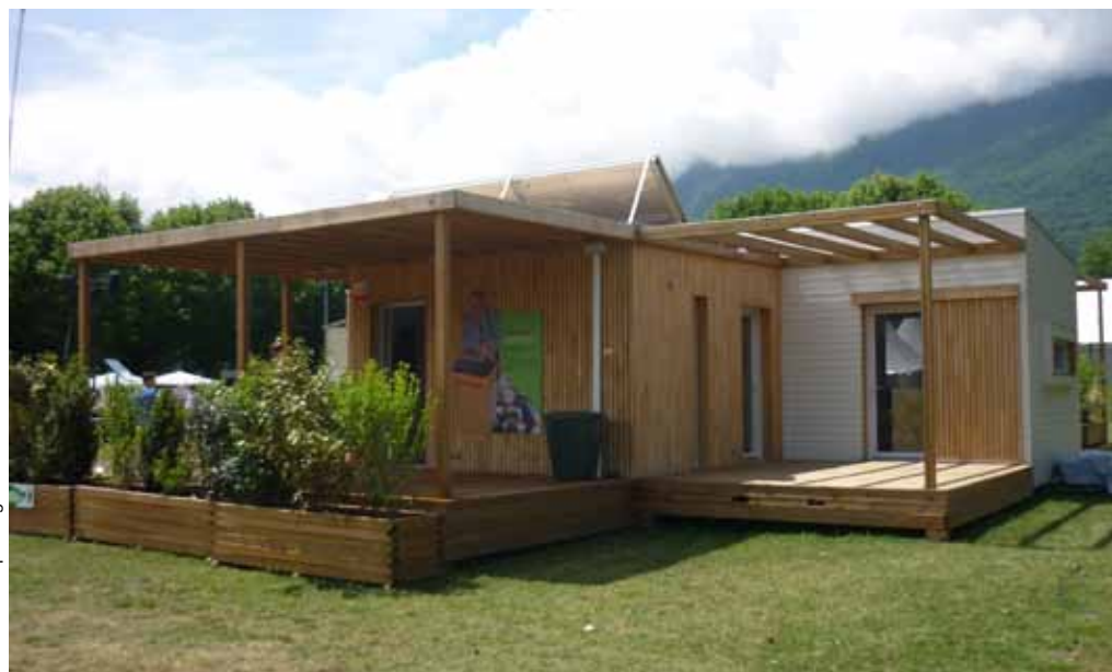
architecte : François Pélegrin

En résumé, cette maison ne fait qu'utiliser des techniques éprouvées et commercialisées. Pas de solution hasardeuse, pas de technologie non éprouvée, du simple, du solide et du bon sens... Des matériaux courants et une mise en œuvre soignée, telles sont les recettes qui permettent d'afficher un prix raisonnable entre 1.200 et 1.500 € le m 2 et des performances BBC.